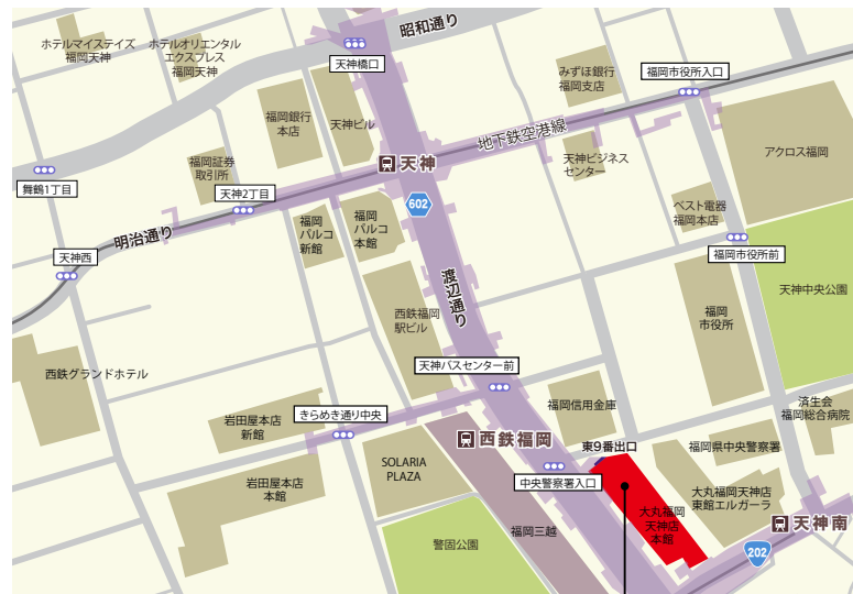
TKPガーデンシティPREMIUM天神スカイホール